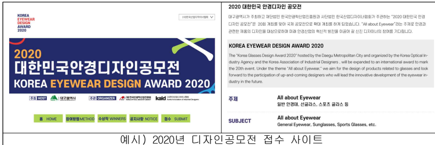
예시) 2020년 디자인공모전 접수 사이트