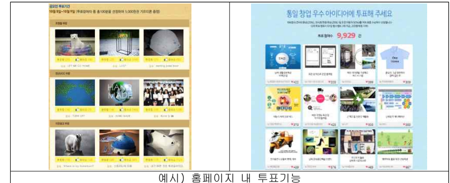
예시) 홈페이지 내 투표기능