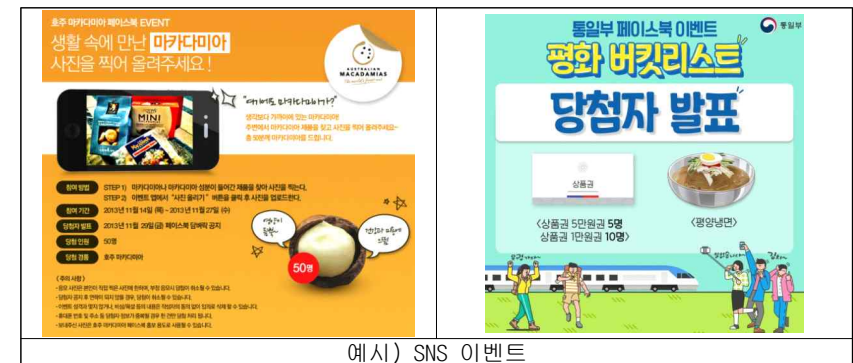
예시) SNS 이벤트