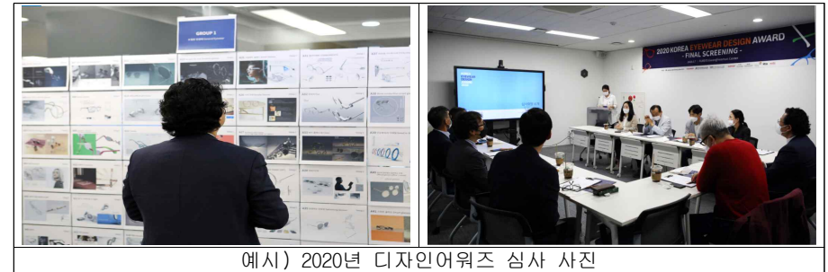
예시) 2020년 디자인어워즈 심사 사진